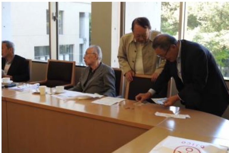
積立金157,279円次期幹事へ引き継ぎ